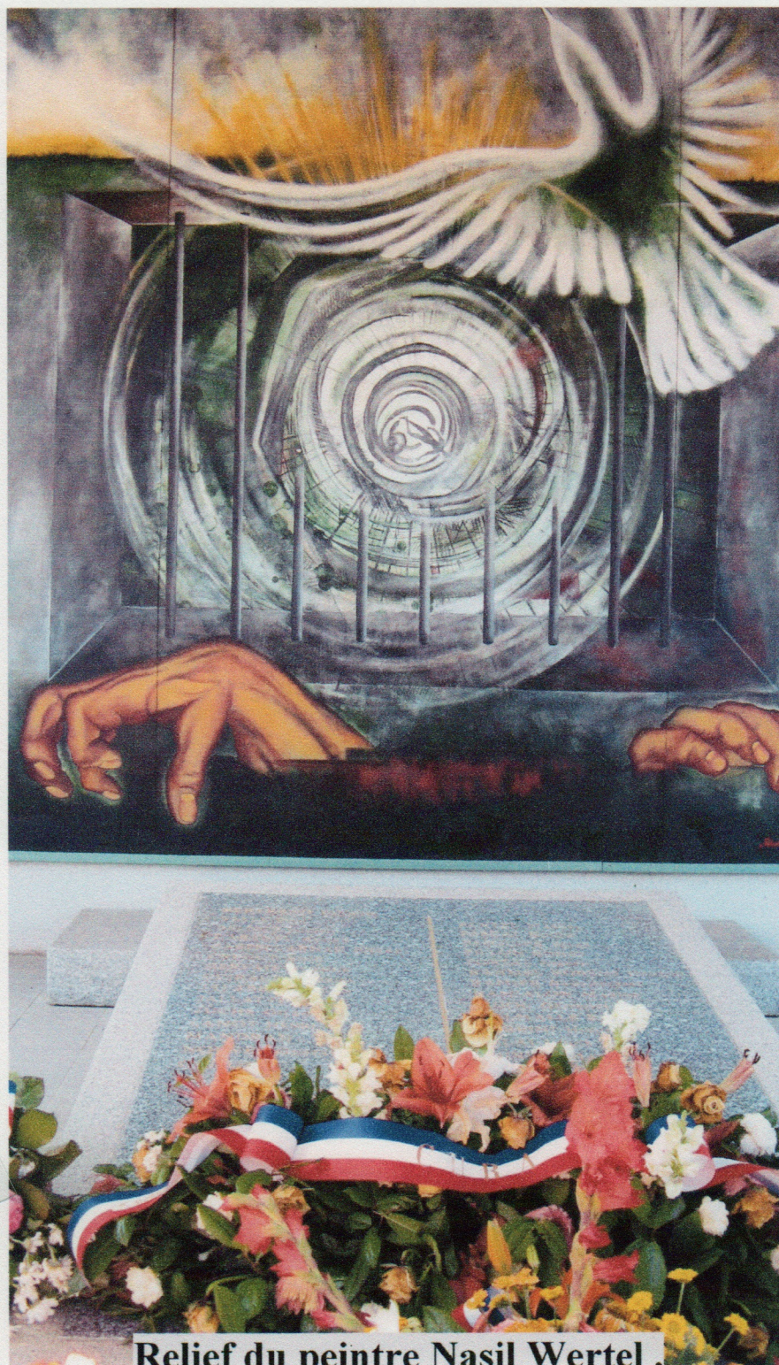
Relief du neintre Nasil Wertel .